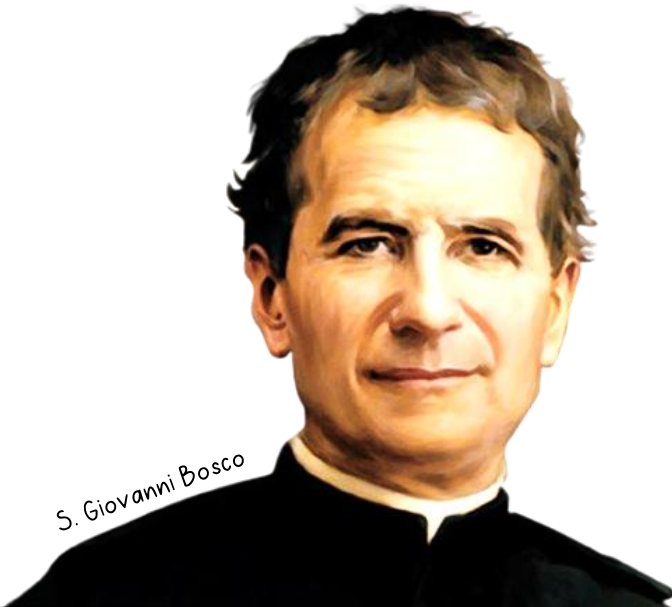
S. Giovanni Bosco